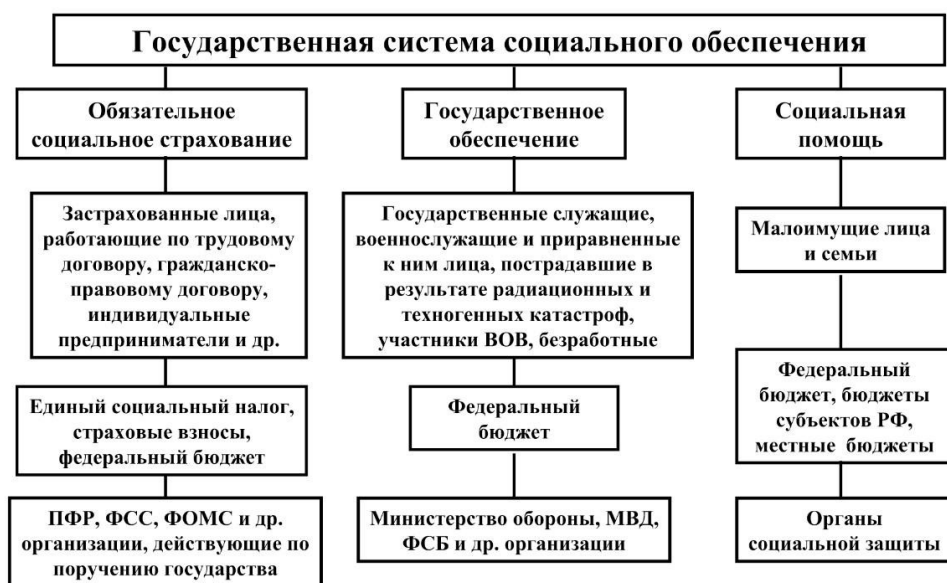
Рис. 1 Организационно-правовые формы социального обеспечения

Государство руководит созданием финансовой базы и организационных структур, необходимых для реализации конституционного права каждого на социальное обеспечение. В результате указанной деятельности возникает государственная система социального обеспечения, которая включает несколько подсистем: обязательное социальное страхование; социальное обеспечение за счет прямых ассигнований из федерального бюджета; государственную социальную помощь. В науке их принято называть организационно-правовыми формами социального обеспечения (см рис. 1.). Указанные формы отличаются друг от друга по субъектам, источникам финансирования, видам выплат, органам управления.